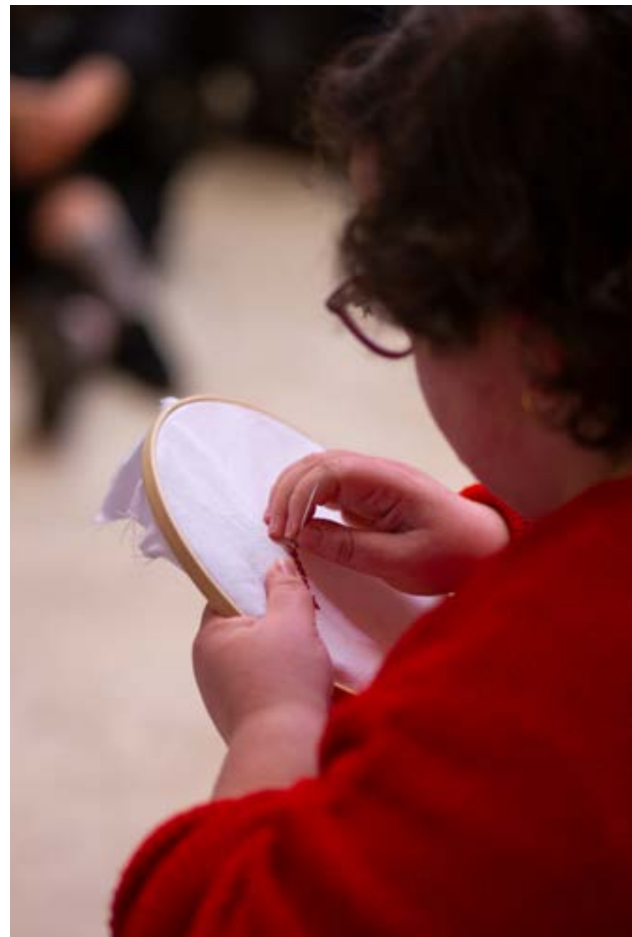
La bordadora. Performance realizada dentro do ciclo «Visión y presencia» comisariado por Semíramis González no Museo Thyssen-Bornemisza (Madrid) o 20 de abril de 2022.