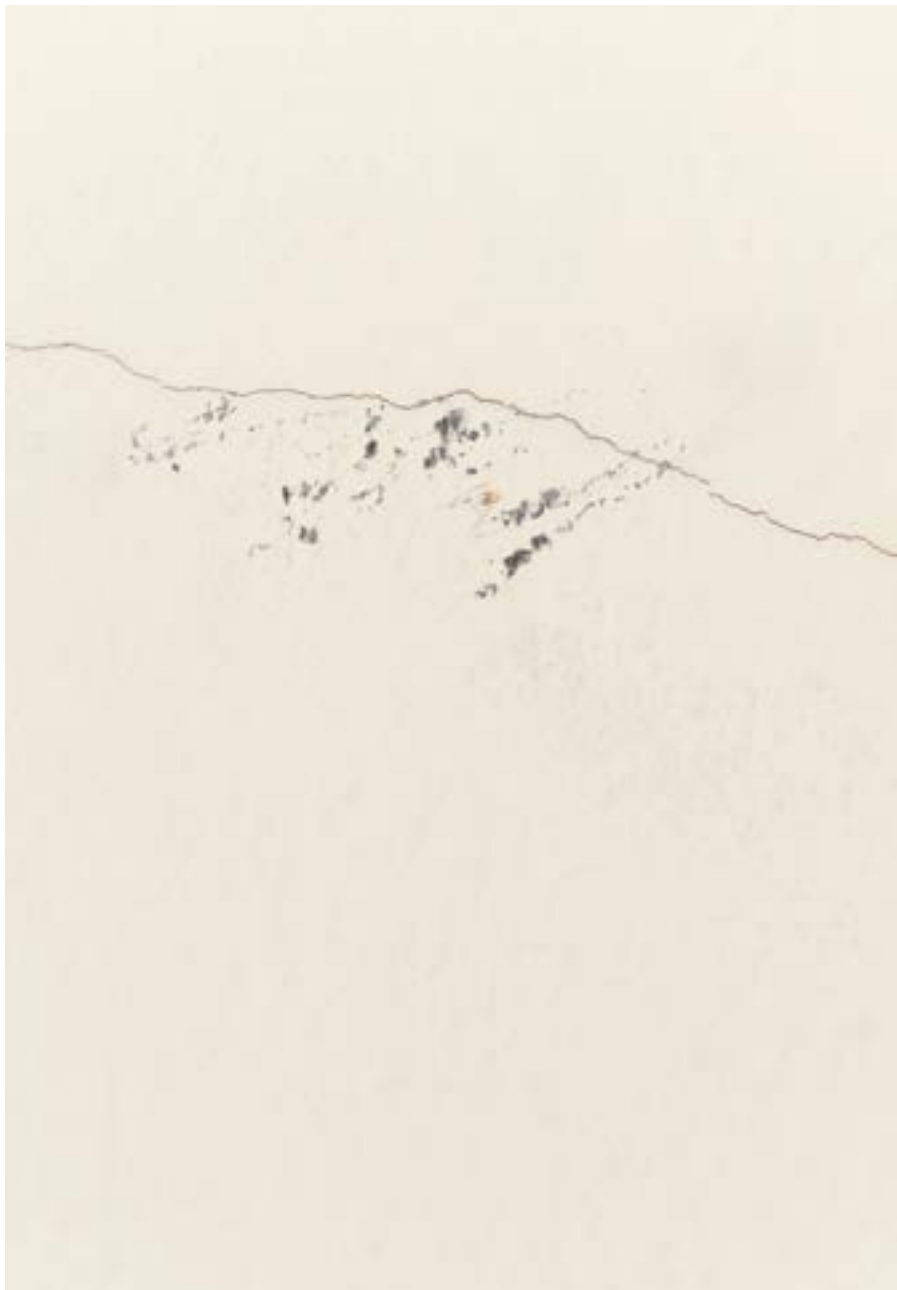
Liminal #3 , 2022. Fotografía. Impresión en papel Hahnemühle Photo Rag Ultra Smooth 305gr. 24x16cm Ed. 3+ 1PA.