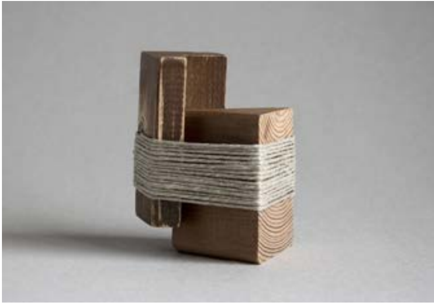
De la serie Teorías del Odradek , 2018. Objeto y fotografía inédita.