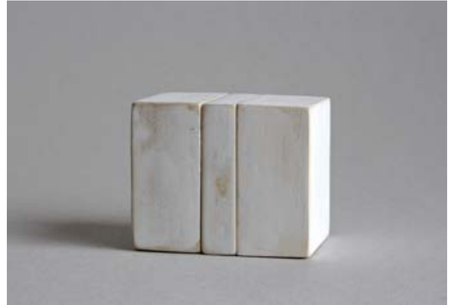
Da serie Teorías del Odradek , 2018. Obxeto e fotografía inédita.