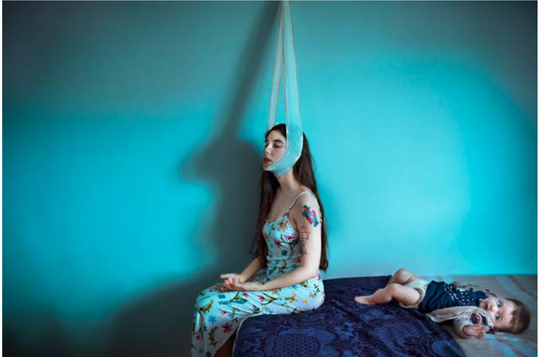
Nunca es la hora del sueño, 2018. Fotografía digital.