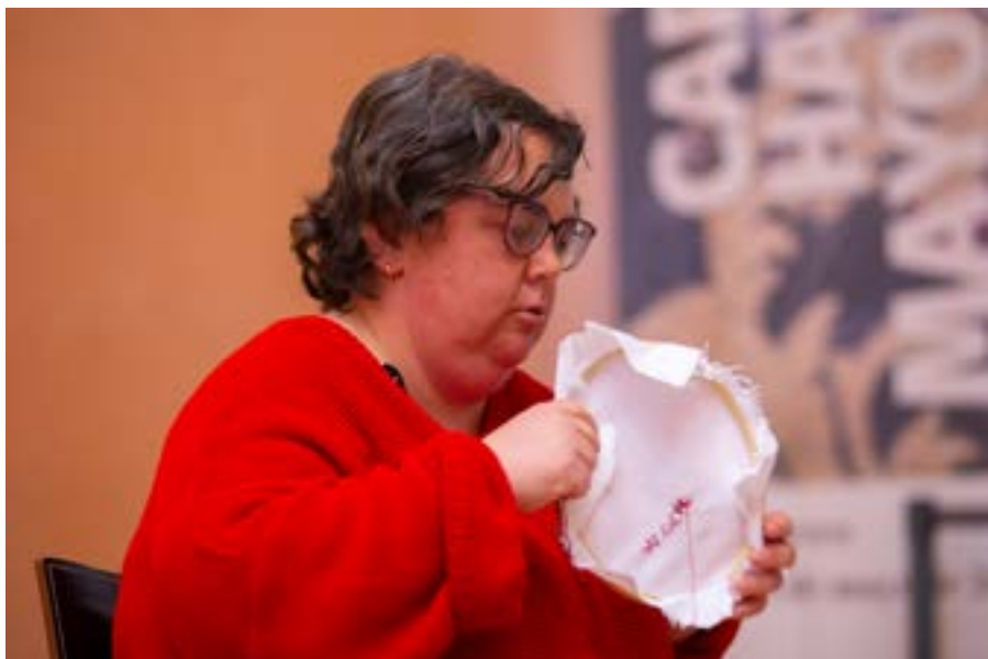
La bordadora. Performance realizada dentro del ciclo «Visión y presencia» comisariado por Semíramis González en el Museo Thyssen-Bornemisza (Madrid) el día 20 de abril de 2022.