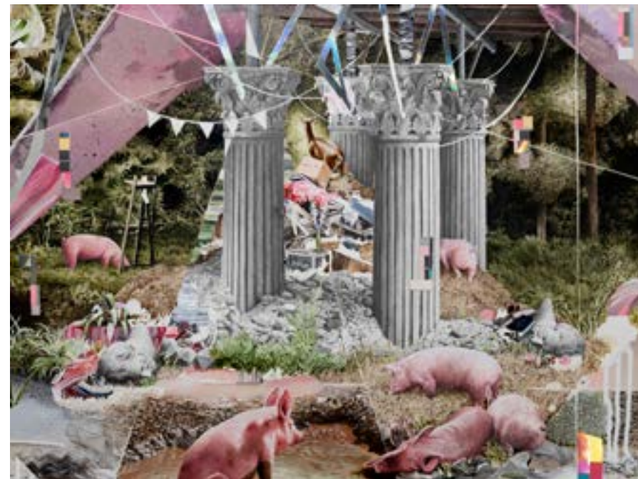
Geología de la humanidad , 2019. Acrílico, collage, rotuladores, lápices de color y spray sobre papel. 160x120 cm