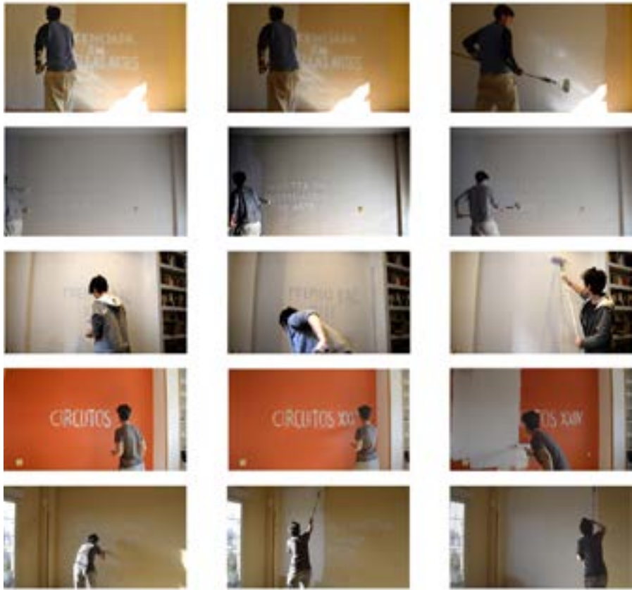
CV en blanco, 2019 Videoacción.