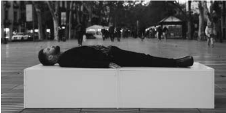
La mercancía, 2021. Performance.