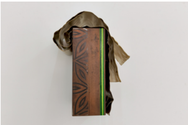
Terrenos y cultivos IV